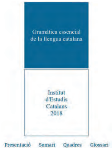
FOTOGRAFIA 9. Pàgina d'inici de la Gramàtica essencial de la llengua catalana .