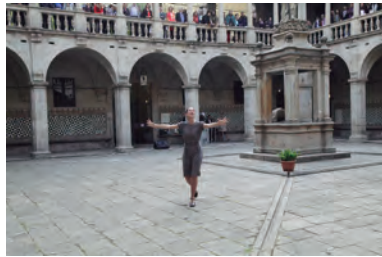
FOTOGRAFIA 15. Espectacle 18 escenes de 'La plaça del Diamant' .