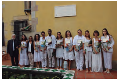
FOTOGRAFIA 3. El president de l'IEC, Joandomènec Ros, amb l'equip de l'Aula de Teatre de la UdG, que oferí l'espectacle Les flors de Rodoreda a cau d'orella en el transcurs de l'acte A l'IEC llegim Rodoreda .