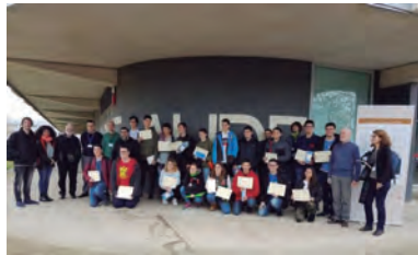
FOTOGRAFIA 10. El president de l'IEC, Joandomènec Ros, amb participants del VIII Dissabte Transfronterer de les Matemàtiques a l'Alt Empordà.

El Dissabte Transfronterer de les Matemàtiques a l'Alt Empordà, activitat que organitzen la Fundació Ferran Sunyer i Balaguer i l'Ajuntament de Figueres, se celebra a Figueres cada primer dissabte de febrer i va adreçat a estudiants de batxillerat de centres d'ensenyament de l'Alt Empordà i les comarques properes, així com de la Catalunya del Nord. L'edició d'enguany va constar de diverses conferències, com ara «L'art de xifrar missatges: la criptografia, un duel d'enginy» o «Xarxes òptimes», a més d'un taller per a professors. Va tenir lloc al Centre de Formació Integrat Ferran Sunyer i Balaguer i comptà amb la presència de Joandomènec Ros, president de l'IEC (fotografia 10).