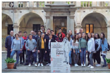
FOTOGRAFIA 6. Grup d'estudiants i professors que segueixen la Ruta Pompeu Fabra en el marc de la I Jornada de Literatura Catalana per a Alumnes de Batxillerat a l'IEC.